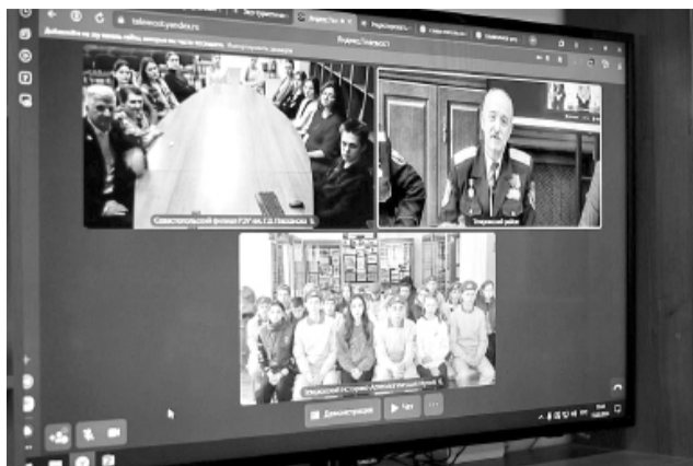
Телемост, посвященный 10-летию воссоединения Крыма и России, объединил две территории: Город-Герой Севастополь и Темрюкский район Краснодарского края.

В видеоконференции приняли участие молодежь Севастополя, непосредственные участники Крымской весны, с одной стороны, а с другой – заместитель Главы муниципального об-