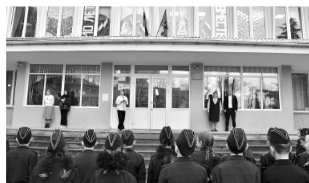
Учебная неделя в российских школах и колледжах по традиции началась с торжественной линейки и внеурочного занятия «Разговоры о важном». В этот раз занятие было посвящено 10-й годовщине возвращения Севастополя и Крыма в состав Российской Федерации.

Школьникам рассказали, что День воссоединения Крыма и Севастополя с Россией 18 марта – государственный праздник. Как 10 лет назад сказал Президент России В.В. Путин, Крым и Севастополь вернулись «в родную гавань». Возвращение Крыма и Севастополя принято считать восстановлением исторической справедливости, поскольку Россия, весь Русский мир неразрывно связаны с Крымским полуостровом, с его историей и культурой.