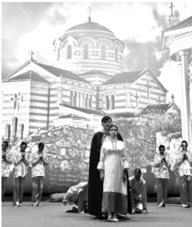
При поддержке Гагаринского муниципалитета для севастопольцев в кинотеатре «Россия» состоялся показ литературно-музыкальной композиции «Севастополь. Вера. Надежда. Любовь» Балаклавского дома детского и юношеского творчества.

Патриотический спектакль был посвящен 10-летию юбилею Русской весны и выборам Президента России.